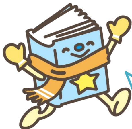
図書館ほんのいち部 部長 ぶらり

2024 年になって最初の「図書館だより」です。今年が、あなたにとって飛躍の一年になりますように、図書館は応援していますよ～！ご来館をお待ちしております♪