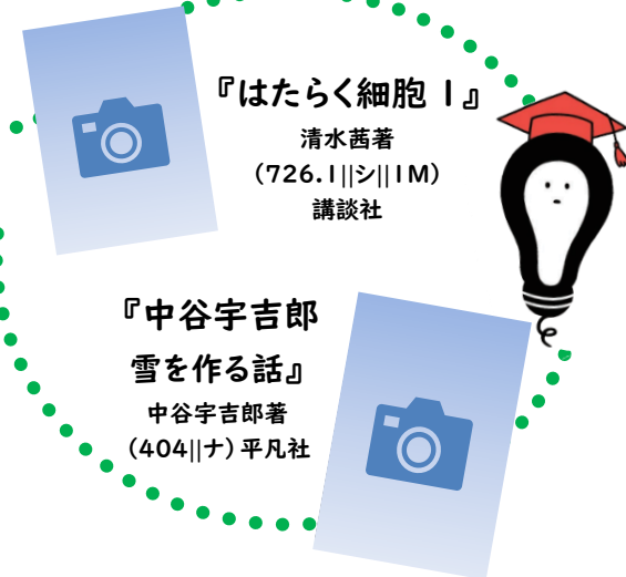
『はたらく細胞1』 清水茜著 (726.1||シ||IM) 講談社

※『科学道100冊』は、日本で唯一の自然科学の総合研究所である理化学研究所(理研)と、本の可能性を追求する編集工学研究所(編工研)が行っているプロジェクトです。