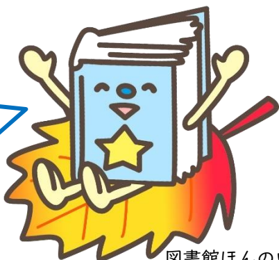
図書館ほんのいち部 部長ぶらり

もうすぐ12月。 期末テストでみなさんが力を出し切れるように、応援しています!図書館3階の参考書コーナーも、役立ててくださいね♪