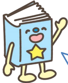
図書館ほんのいち部 部長 ぶらり

2023 年は、うさぎ年。冬は大学や検定試験など、受験やテストが多い時期でもあります。